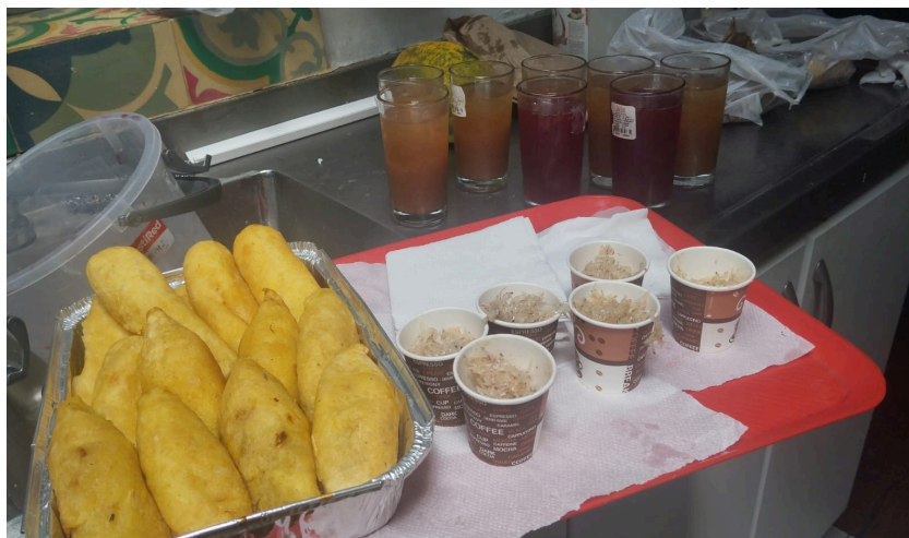
Fotografía 1. Refrigerio etnico.