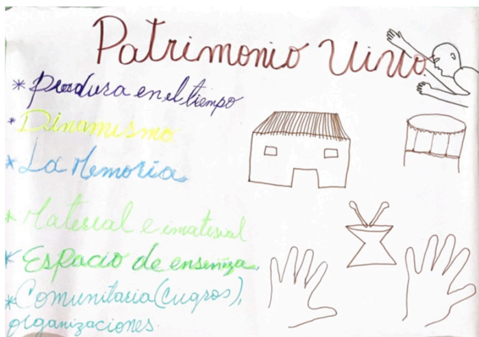
Imagen 1 Cartelera Grupo Verde

Manifestación Cultural: En la cartelera del grupo amarillo representaron el concepto de manifestación cultural con la analogía del tambor llamador, con el cual se puede evidenciar todas las actividades, prácticas, saberes, conocimientos, participación comunitaria que son propias a la música palenquera y a este instrumento específico, señalando que esta trasciende en todo momento de la vida cotidiana palenquera, pero también tiene un trasfondo que hace que esta manifestación haga parte de otras manifestaciones sin excluirse, sino integrando un sistema cultural complejo, reconociendo la importancia de las personas sabedoras para mantener estos legados reflejados en las diversas manifestaciones culturales de la comunidad palenquera.