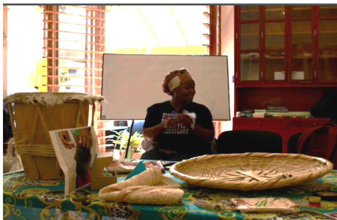
Fotografía 1. Objetos y elementos del territorio que habitan las personas participantes.